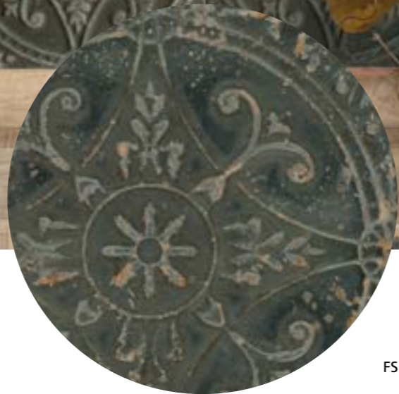
FS Saja N