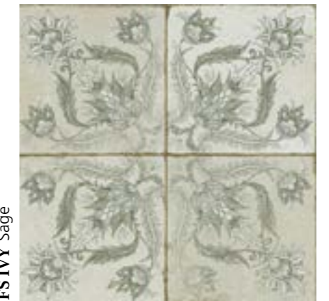
FS IVY Sage