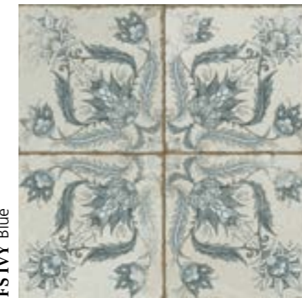
FS IVY Blue