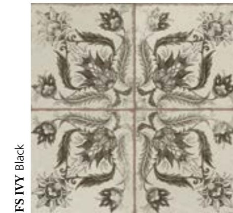
FS IVY Black