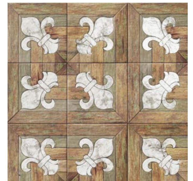
MEDICI NATURAL M-280 20x20 cm · 8"x8"