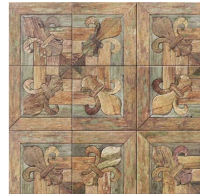
QUATTROCENTO NATURAL M-220 20x20 cm · 8"x8"