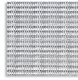
Nogal R-8 G.120