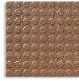
Arce R-14 G.120