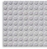
Nogal R-14 G.120