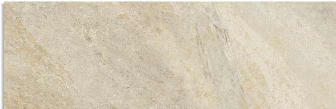
Glen Natural G.202