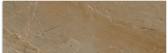
Glen Tierra G.202