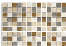
(2) Tasos Multicolor 23x33,5 cm. G.140