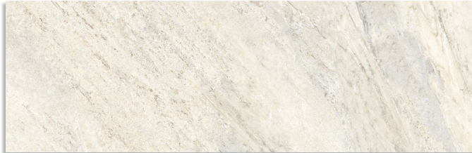
Glen Blanco G.202