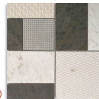
(1) Mosaico Kyra Gris 30x30 aprox. G.76