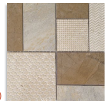
(1) Mosaico Kyra Beige 30x30 aprox. G.76