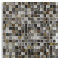
(*) Mosaico Magal Gris 30x30 aprox. G.94