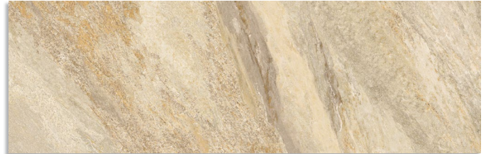
Glen Beige G.202