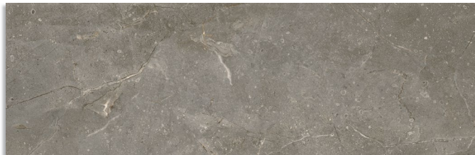
Glen Antracita G.202