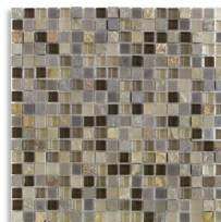
(*) Mosaico Magal Beige 30x30 aprox. G.94