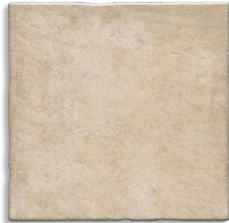
Atrio Beige G.120