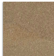
Corner Marrón G.143