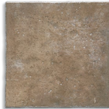
Atrio Tierra G.120