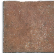
Atrio Cuero G.120