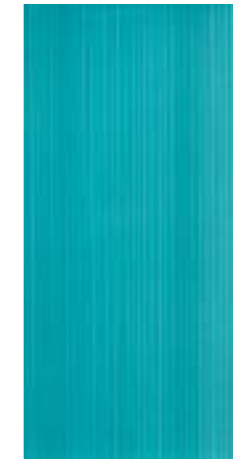
CRDC 36TQ 30X60 -12"X24"