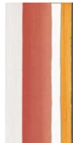
CRDC DK2 36M △ 30X60 -12"X24"