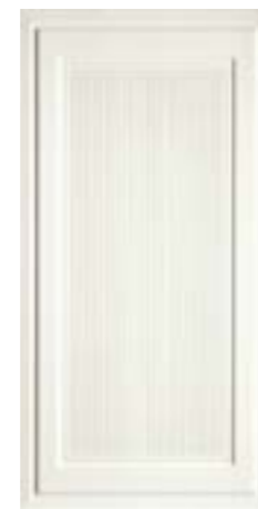
CRDC L 1X60W △ 1X60 -0,4"X24"