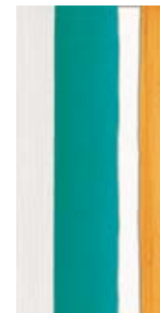
CRDC DK2 36TQ △ 30X60 -12"X24"