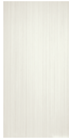
CRDC 36W 30X60 -12"X24"