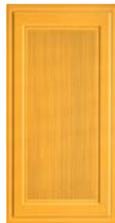
CRDC L 1X60Y △ 1X60 -0,4"X24"