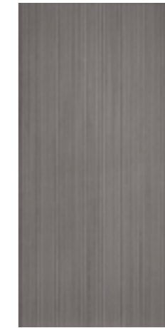
CRDC 36DG 30X60 -12"X24"