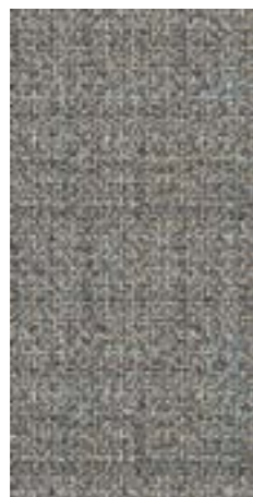
CRDC DK 36DG △ 30X60 -12"X24"