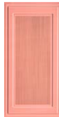
CRDC L 1X60M △ 1X60 -0,4"X24"