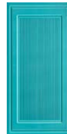
CRDC L 1X60TQ △ 1X60 -0,4"X24"