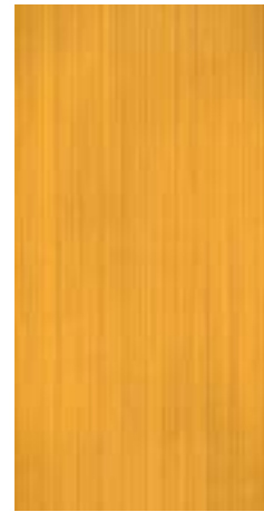
CRDC 36Y 30X60 -12"X24"