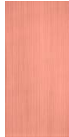
CRDC 36M 30X60 -12"X24"