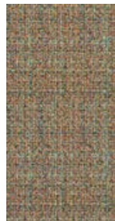
CRDC DK 36MIX △ 30X60 -12"X24"