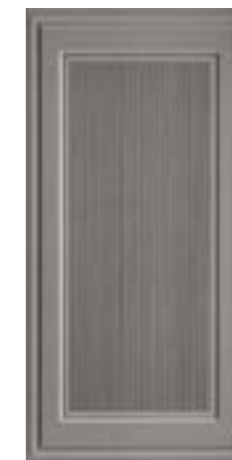
CRDC L 1X60DG △ 1X60 -0,4"X24"